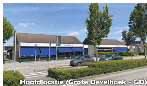
Hoofdlocatie (Grote Develhoek - GD)