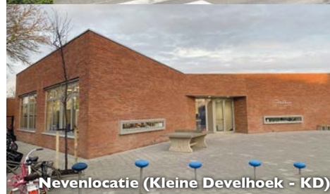
Nevenlocatie (Kleine Develhoek - KD)